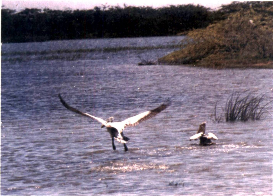
පරිසරය කොදුරු නිරූපණයක් - ඉහළ