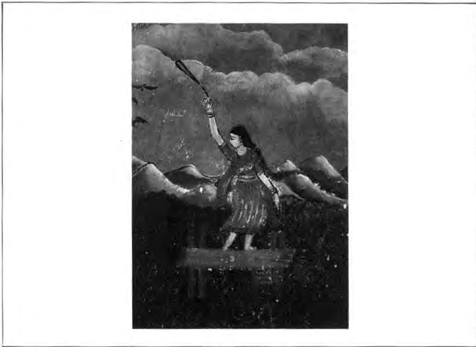
වල්ලි අම්මා, විහාර සිතුවමකි

“ඔහු පැමිණ අපට ද්‍රව්‍යවල වෘක්ෂයන්ගේ හා සතුන්ගේ නම් කියාදුන් අතර දඩයම සඳහා වනාන්තරයට යනවිට හා වෙනත් අවස්ථාවලදී පූජා හා නැටුම් පැවැත්විය යුතු ආකාරය ගැන ද කියා දුන්නේය. අප දන්නා හැම දෙයක්ම කියා දුන්නේ ඔහුය” යි වැඳිජනයා පවසති.