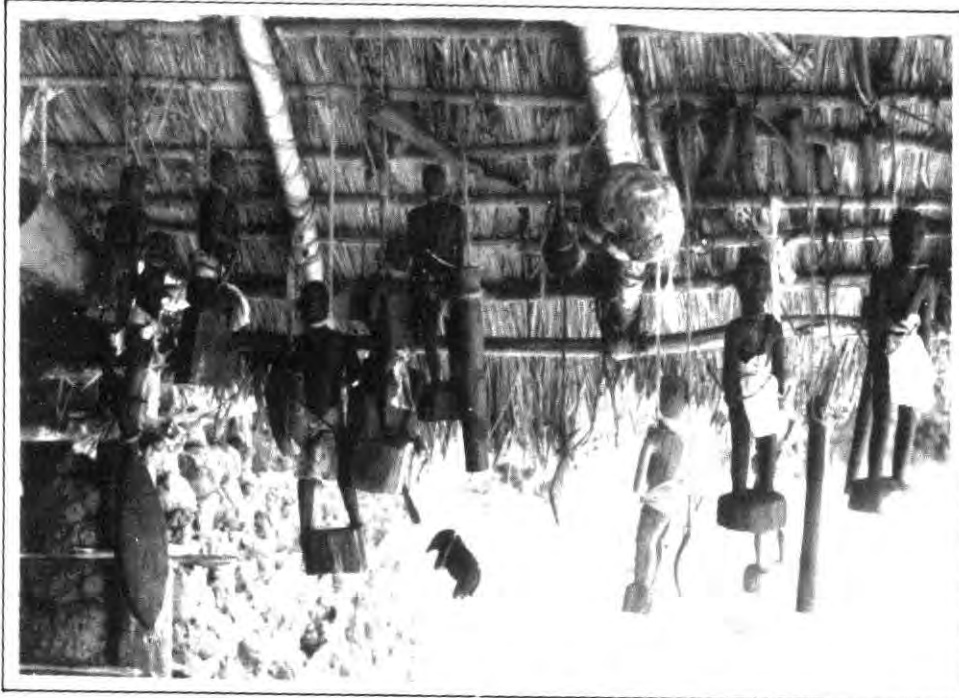
වැදි නායක නිසාහාමගේ අත්කම් කිහිපයක්

බිජ අස්වනු බවට පත්වන්නේ අහසේත් පොළවේත් පවතින යම් බලවේගයක ප්‍රතිඵල නිසා බව දන්නා හෙයිනි. අස්වනු නෙලා එහි මුල් කොටස තමාට උපකාර කළ යකුන්ට පුදන්නට වැද්දෝ අමතක නොකළහ. එමෙන් ම හේනේ ආරක්ෂාව සලසා ගන්නා ලද්දේ ද අතු ඵල්ලා යකුන්ට භාර කිරීමෙනි.