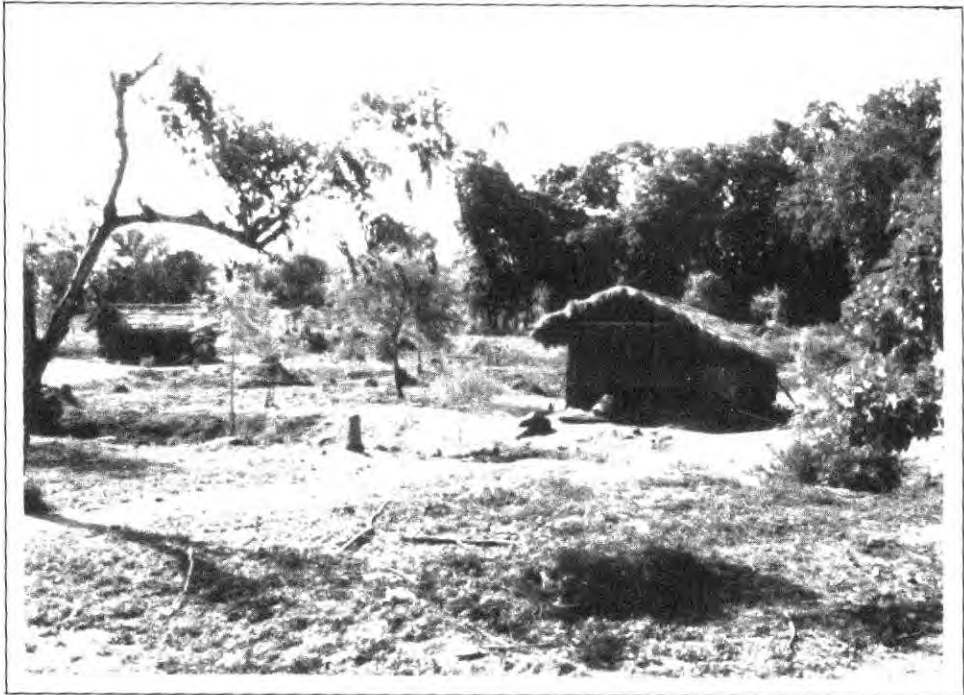
කැලෑව අසල මිනිසා වැදි ජනතාවගේ සම්මත පිළිවෙලයි.

භාෂාවෙන් හෙළිවන අනෙක් වැදගත් කරුණ නම් වැදි ජනතාව ජීව සංහතිය කෙරෙහි දැක් වූ සමානාත්මතාවයි. තමන් හඳුනා ගන්නට "මේ අත්තෝ" කියා යොදන අතර අනෙක් සියලුම ජීවී නාම අගින් "අත්තෝ" යන්න භාවිත කරයි. දඳාහරණ වශයෙන් අම්මල අත්තෝ (අම්මා) අප්පල අත්තෝ (තාත්තා) බොටකදාල අත්තෝ (අලියා) පොල්ලැවිලලා අත්තෝ (කොටියා) ඔප්පිල අත්තෝ (කුරුල්ලා) ආදී වශයෙන් පණ අත්තී සියලු දෙනාම තමන් හා සමාන යන අරුතකින් එකම පදයෙන් හඳුන්වනු ලැබේ. මිනිස් සමාජයේ වුවද විවිධ තරාතිරමි අතර වැදි සමාජයේ එවැන්නක් නොවීය. සියලුම පිරිමින් හැඳින්වීමට 'හුරා' යන පදය යෙදිය