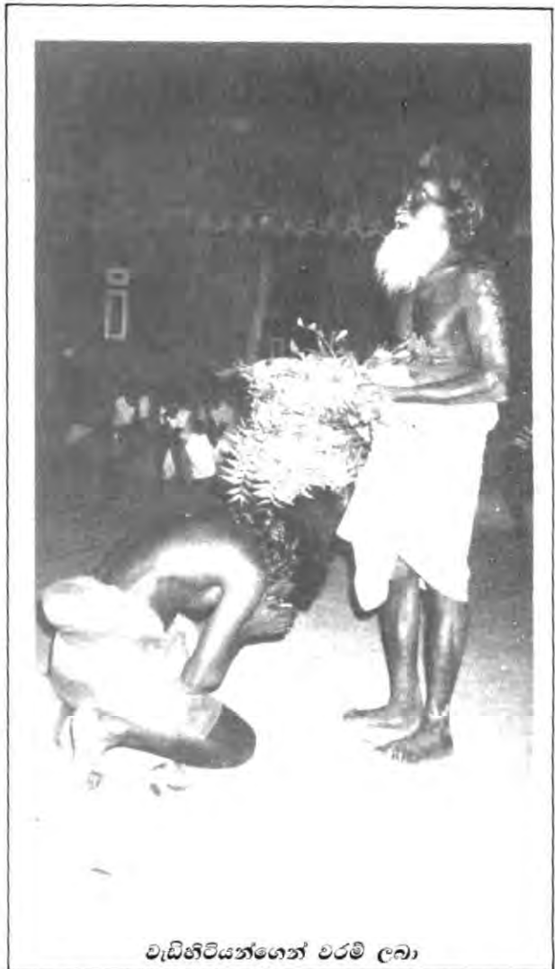
වැඩිහිටියන්ගෙන් වරම් ලබා

පුද්ගලයා, සොබාදහම පුද පෙත් හා මළවුන් අතර සිවුකොන් සම්බන්ධයක් ඇති වෙයි. ප්‍රකෘතියේ ඇති දෑ අඩු වැඩි කරනුයේත්, එය පුද්ගලයා වෙත ළඟා කර දෙනු ලබනුයේත් මළවුන් විසිනි. මළවුන්ට එසේ කිරීමට හැකි වන්නේ සොබා දහමින් ලබා ගත් දැඩිත් පුදපෙත් ඉදිරිපත් කොට මළවුන්ගේ එලෝ පැවැත්මට ආධාර කළහොත් පමණි. මේ අනුව මළවුන් හා ජීවත්වන්නවුන් අතර ගනුදෙනුවක් ඇති බව පෙනී යයි.