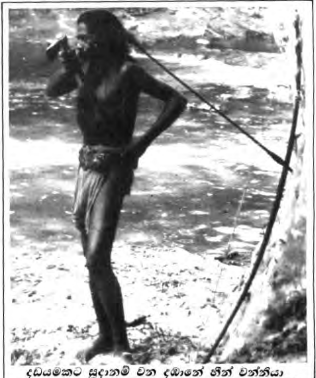
දඩයමකට සූදානම් වන දඩානේ හීන් වන්නියා

ඔවුන්ගේ ජීවිතය පරිසරය මත රඳාපැවතුණේත් එය ඔවුන් අතින් සුරැකිණ. ඔවුන්ගේ ප්‍රධාන ආහාරයට අල වර්ග, මී පැණි සහ මස් වර්ග අයත් විය.