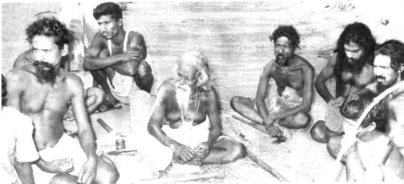
1993 ආදිවාසීන්ගේ වසරයි. ඒ ඒ රටවල ආදිවාසීන්ගේ සුභසාධනය කෙරෙහි විශේෂ සැලකිල්ලක් දැක්වීම මේ වසරේ දී අපේක්ෂා කෙරේ. පාරිසරික හා පාර්ලිමේන්තු කටයුතු අමාත්‍යාංශය පසුගියදා ශ්‍රී ලංකා ගුවන් විදුලි සංස්ථාවේ අනුග්‍රහයෙන් දඹානේ දී ශ්‍රී ලංකාවේ වැදි ජනතාව ගැන සර්වි ගුවන් විදුලි වැඩ සටහනක් විසුරුවා හරින ලදී.