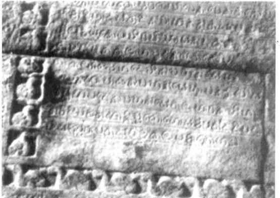
පුවරු ශිලා ලිපියක්

අතීත හා වර්තමාන තත්වයන් මෙසේ පවතිද්දී ගහකොළ සතා සීපාවා සේම පරිසරය හා එහි සංරක්ෂණය පිළිබඳව ඇති උනන්දුව උද්‍යෝගය දිනෙන් දින වැඩි වන අතරම තවත් පසෙකින් පරිසරය විනාශවීම ද ඒ හා සමානවම සිදු වෙමින් පවතී.