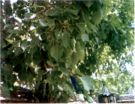
බෞද්ධයින්ගේ වන්දනාමානායට ලක් වන බෝධි වෘක්ෂය

ඒ අනුව බුදු දහමේ වන සංරක්ෂණය, වායු සංරක්ෂණය, ජල සංරක්ෂණය, ශබ්ද සංරක්ෂණය, සත්ත්ව සංරක්ෂණය, ආදී පරිසරයේ සියලුම අංගයන් ආරක්ෂා කිරීමේ වැදගත්කම සිය දේශනා තුළින් වඩාත් අවධාරණය කර ඇති බව හඳුනාගත හැකිය. හුදෙක්ම මිනිසා තෘෂ්ණාවෙන් ඇලී මමය, මාගෝය, යන හැඟීමෙන් වඩවඩාත් කටයුතු කිරීම තුළ පරිසරය පමණක් නොව තමාගේ ද විනාශය සිදුවන බව බුදුන් අනුදැන වදාරා, තිබේ. එබැවින් භාගයෙන්, දේශයෙන්, ඇලීමෙන් මිදුණු කළ පරිසරය වඩාත් යහපත් තැනකට ගමන් කරන බව බුදුදහම තුළ ඇති අදහස් සමස්ථයක් වශයෙන් ගෙන බලන කළ හඳුනාගත හැකිය.