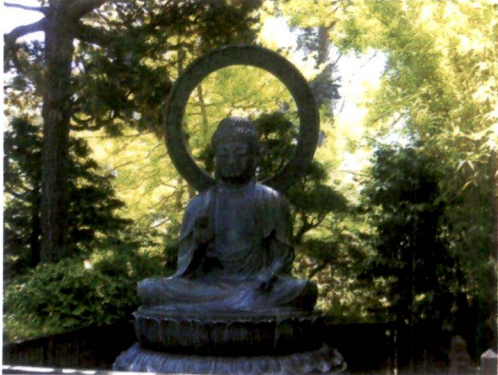
බුදුන් වහන්සේ බොහෝ අවස්ථාවල දිවා විවරණය මඹාගෙන ඇත්තේ ද පිරිසිදු වානාශ්‍රය ඇති වෘක්ෂ මූලයක සිටිය. මහ රහතන් වහන්සේලාට භාවනායෝගීව සිටීමට ද වනාන්තර පෙදෙස ඉතාමත් යෝග්‍ය බව බුදු දහමේ හඳුන්වා ඇත.

අප ඉහතින් ඉදිරිපත් කළ කැරැහුම් අනුව පරිසර ගැටළුවට කඩිනම් පිළිතුරු සැපයීමේ අවශ්‍යතාව අවධාරණය වනවා සේම පරිසර ගැටළුව පිළිබඳ වෙනත් දෘෂ්ඨි කෝණයකින් සාකච්ඡා කිරීමේ අවශ්‍යතාවය ද ඉස්මතු වේ. මේ අනුව පරිසරය සම්බන්ධව බෞද්ධ දර්ශනය තුළ ඇති මනවාදයන් මඟින් පරිසර සංරක්ෂණයට යම් වැඩිපිළිලෙක් සකසා ගැනීමට හැකි ද යන්න සොයා බැලීමට හැකියාව ලැබේ.