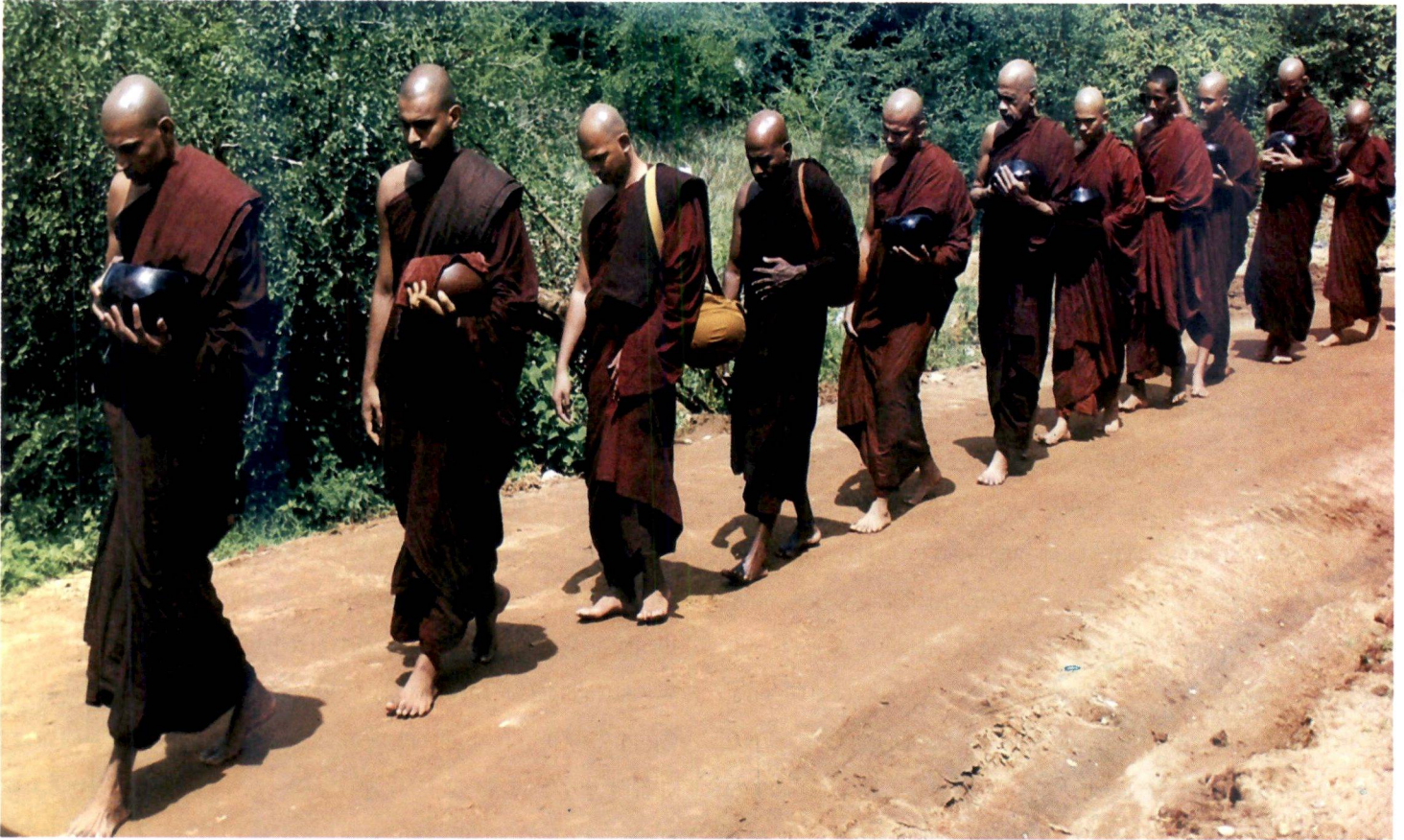
විශේෂයෙන්ම බුදුන් විහාරයේ වැසි සමයෙහි වැස් විසීම අනුදැන වදාරා ඇත. මන්ද වැසි සමයෙහි අලුතින් දැවී ලගා නාණ වර්ග මල් මෙන්ම සතුන්ද බිත්ති වාර්තාවේ යෙදීමෙන් විනාශ වීම වැළැක්වීම වැඩි කරමුණයි