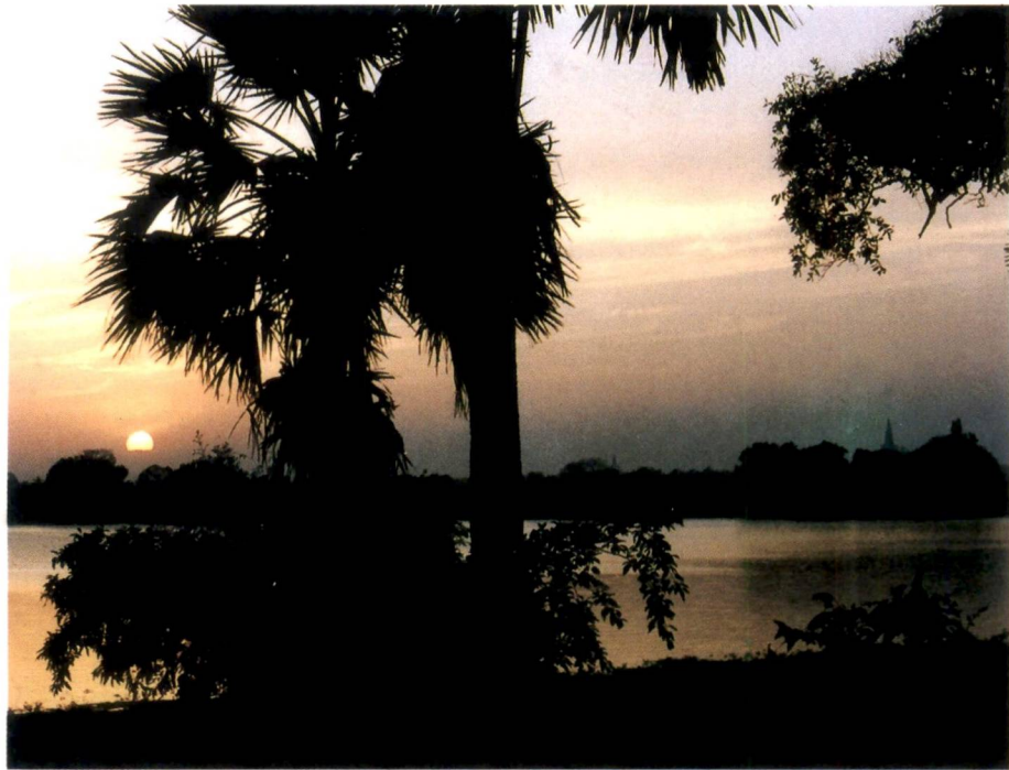
සේනාරාම: එම්. ඒ. එස්. ජේ. ද. ගෝඨභා