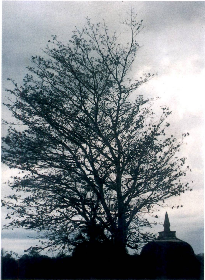
පරිසරය හා සබැඳුණු සංස්කෘතියක් _____

ටොලමිගේ ලංකා සිතියමට අනුව රෝහණ ජනපදයේ අගනුවර වූ මාගම පිහිටා තිබුණේ හැප්පි හෙවත් ගංගා හෝ මහගංගා යනුවෙන් හැඳින්වූණු ගඟක වම් ඉවුරේය. පොළොන්නරුවෙන් ලැබුණු දහවැනි සියවසට අයත් ටැම්ලිපියක ඇළසර හෙවත් ඇළහැර පිහිටා තිබුණේ මහගංගා නම් නදියක් අසබඩ බව සඳහන් වේ. ඇළහැර පිහිටා ඇත්තේ මහවැලි ගඟේ ප්‍රධාන ශාඛාව වූ අඹන්ගඟේ වම් ඉවුරේය. මෙහි පුරාණ නගරයක නටඹුන් අද පවා දකිය හැකිය. මේවා පැරණි මාගම නගරයේ නටඹුන් වශයෙන් හඳුනාගත හැකිය. මේ අනුව පුරාණ රෝහණ ජනපදය අඹන්ගඟ ආශ්‍රිතව පිහිටුවා ගන්නා ලද බව පැහැදිලිය. දනට පුරාණ මාගම නගරය වශයෙන් හඳුනා ගන්නා තිස්සමහරාම ප්‍රදේශයේ රුහුණේ අගනුවර පිහිටුවා ගනු ලැබ ඇත්තේ ක්‍රි.ව. අටවැනි සියවසේ අග භරියේදී බවට සාක්ෂි ඇත.